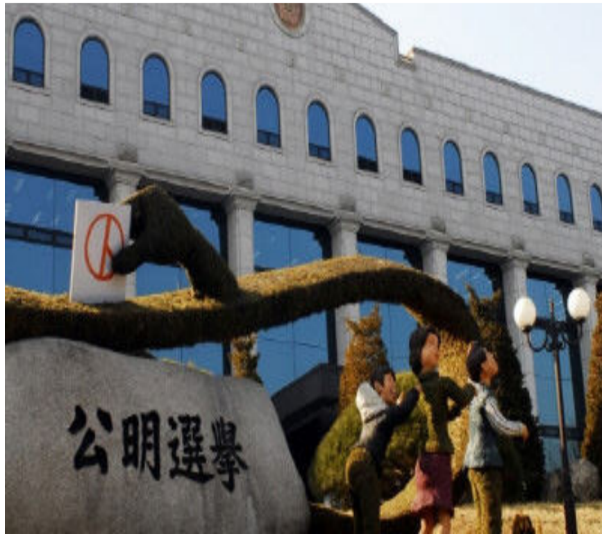
국민의 지탄 대상이 된 헌법기관인 중앙선거관리위원회.

중앙선거관리위원회는 헌법 제114조에 따라 대통령 임명 3명, 국회 선출 3명, 대법원장 지명 3명 등 9명으로 구성된다. 위원장은 호선한다고 돼 있으나 대법관이 관례로 맡아왔다. 광역시·도 선관위원장은 지방법원장이,