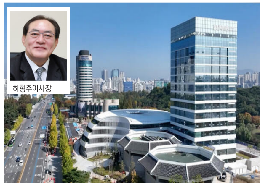
서울 송파구에 위치한 국민체육진흥공단 전경.

한편 체육공단은 정부의 재정 집행 계획에 발맞춰 올 상반기 집행 목표를 72.6%로 설정하고 조기 집행을 통한 민생 경제 활성화에 적극적으로 나설 계획이다.