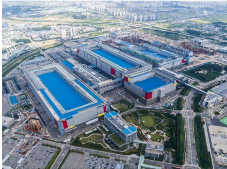
삼성전자 평택 반도체공장 전경.

이같은 배경으로는 기술력과 인재부족이 가장 큰 원인으로 작용했다고 전문가들은 보고 있다. 실제로 최근 몇 년간 산업 스파이 사건이 지속적으로 발생해 한국의 핵심기술이 해외, 특히 중국으로 빠져 나갔다. 경찰청 국가수사본부(이하 국수본)가 최근 적발, 발표한 ‘해외 기술유출 실태’ 보고서에 따르면 지난해 우리나라의 국가핵심기술 해외 유출은 총 27건에 달했다. 이는 국수본 출범 이래 최다 수치다. 국가별로는 중국이 20