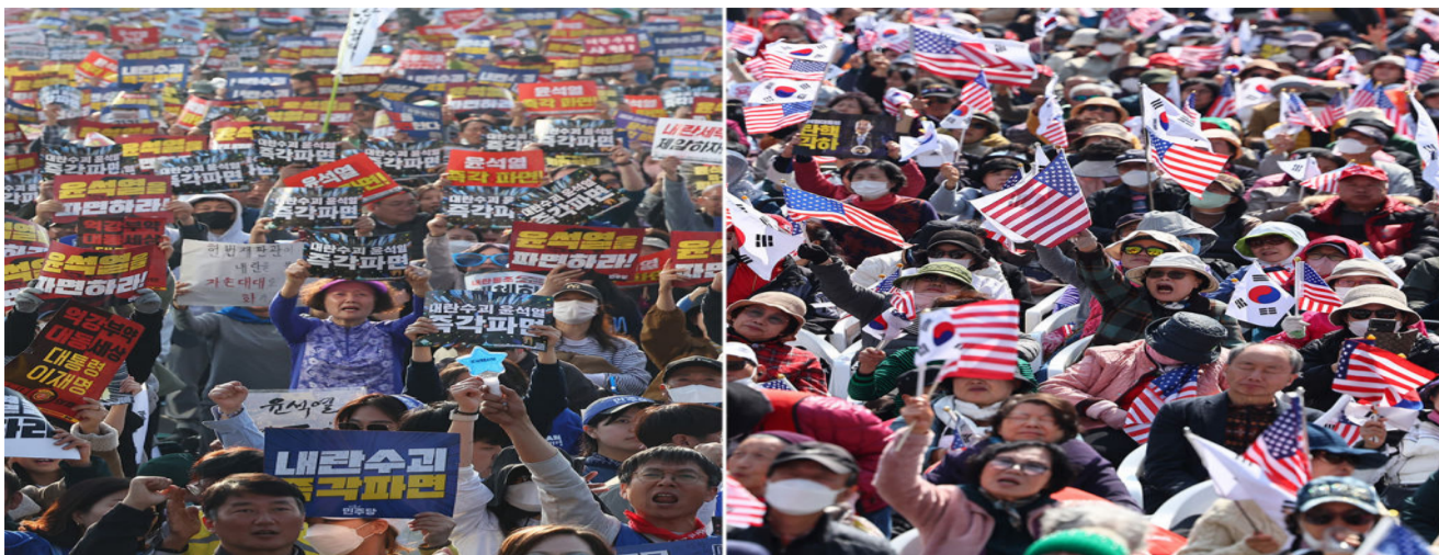
탄핵 찬반 집회는 태극기를 들었느냐 아니냐로 구별된다. 왼쪽이 탄핵 찬성집회, 오른쪽이 탄핵 반대집회다.