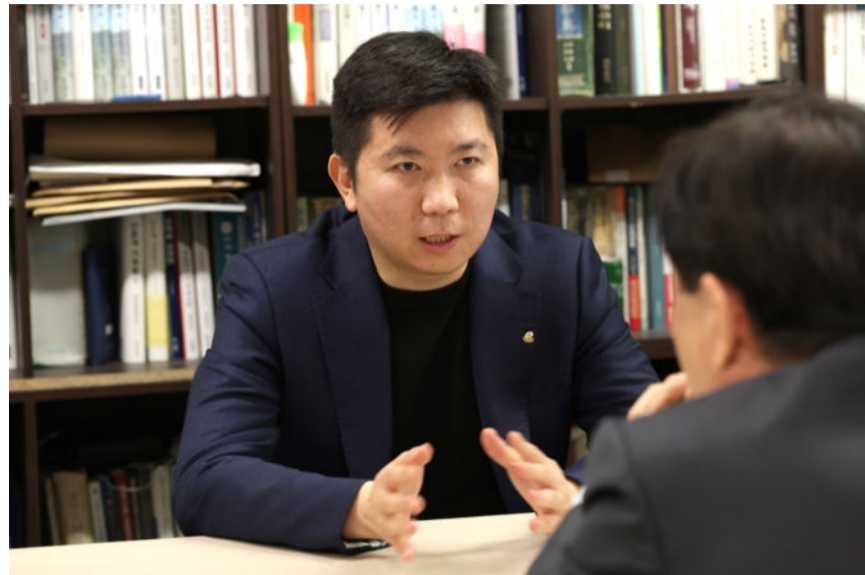
유승민 신임 대한체육회장이 3월 12일 한국프레스센터 대한언론인회 사무실에서 가진 '대한 언론'과의 회견에서 필자의 질문에 진지한 표정으로 응답하고 있다.

지난 3월 12일 한국프레스센터 대한언론인회 사무실. 필자와의 인터뷰에서 유 회장은 자신감 넘치는 화법