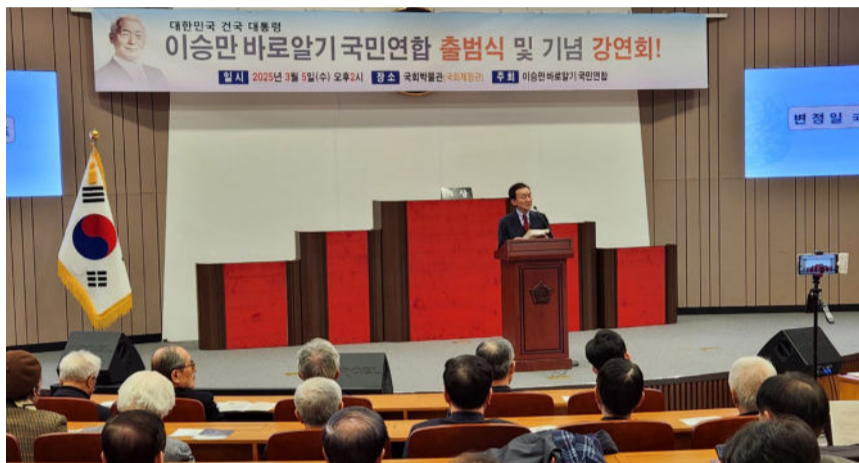
이승만 바로알기 국민연합 출범식 및 기념 강연회 모습.

지에서 벌어진 일과 나치 치하의 프랑스에서 벌어진 일을 비교해야 등가의 비교가 가능하다.