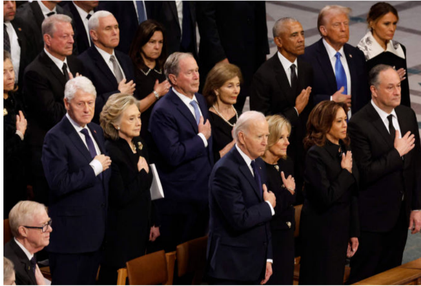
카터 대통령 장례식에 참석해 마지막 인사를 하는 미국 전·현직 대통령.

비록 잠시일지라도 화해와 관용이 흐르는 영결식 중계방송을 보면서 필자는 내 나름의 또 다른 추억과 감회에 빠져들게 되었다. 조지아 주지사이던 지미 카터가 1976년 백악관을 향한 출사표를 던지면서 펴낸 자서전을 필자가 우리말로 옮겨 출판한 인연이 있어서다. 『Why Not The Best?』(최선을 다했는가) 라는 타이틀의 카터 자서전을 번역하면서 워싱턴 정가의 때가 묻지 않은 남부 출신 다크호스 정치인을 발견한 신선한 기분을 맛보았다. 그리고 공교롭게도 필자는 포드와도 작은 인연이 있다. 1974년 워터게이트 도청사건으로 닉슨 대통령이 사퇴함으로써 부통령이던 포드가 졸지에 제38대 백악관 주인이 되었을 때 그의 자서전을 발췌 번역하여 우