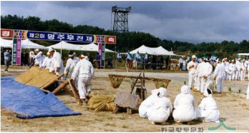
강원도 강릉에서는 해마다 동예의 무천 축제를 재현하는 행사를 개최하고 있다.