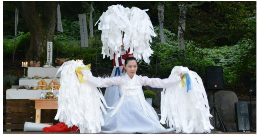
충북 옥천에서 재현된 부여 영고 축제 모습.