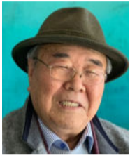
한영탁 본회 자문위원 수필가

지난 1월 9일 워싱턴 대성당에서 미국 제39대 대통령을 지낸 지미 카터의 장례식이 치러졌다. 퇴임을 눈앞에 둔 조 바이든 현직 대통령과 조지 부시, 빌 클린턴, 버락 오바마, 도널드 트럼프 등 네 명의 전직 대통령들이 한 자리에 모인 거창한 영결식이었다.