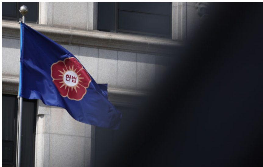
국민의 신뢰가 무너지며 사법부의 권위에 어두운 그림자가 드리워지고 있다.

얕친데 덮친 격으로 3월 26일 이재명 공직선거법 위반 2심 판결이 무죄로 나오자 국민들의 마음은 말 그대로 낙심천만이다. 1심 유죄 판결 이유가 모조리 뒤집혔다. 김문기와 골프를 치지 않았다는 이재명 발언이 단순한