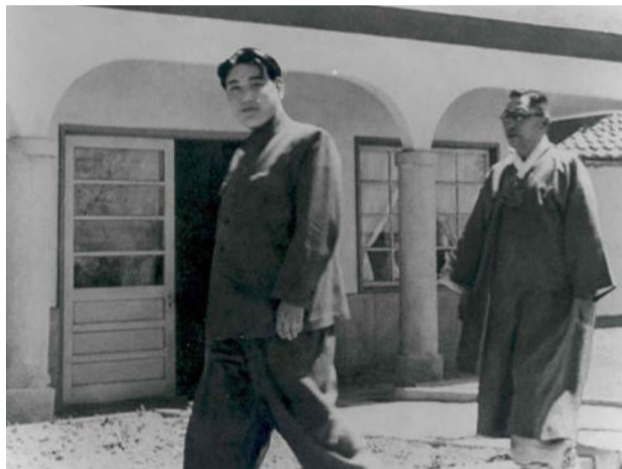
▲평양의 남북대회에 참석한 김구가 김일성(왼쪽)과 단독 면담하러 따라가는 모습.

[백범일지]에 보면 “공산당을 여럿 죽였다”는 기록도 있고 “소련 공산체제가 가장 무서운 독재”라고 규탄하기도 한다.