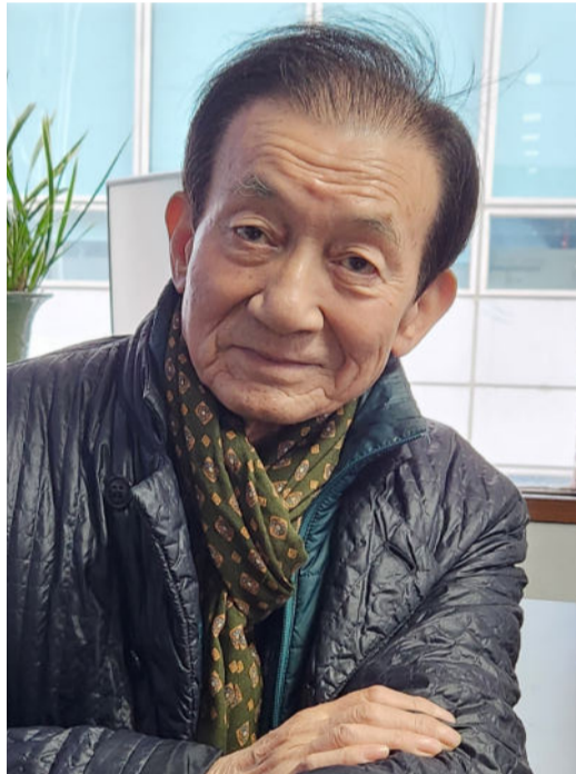
출합니다. 번듯한 기념관과 동상 같은 조형물이 세워졌어도 벌써 세워졌

알려진 것이 너무 많은게 현실입니다. 일제에 맞서 싸운 독립투사 보고 친일 파라든가, 남북분단의 원흉이라든가, 6·25 전쟁 때 백성을 버리고 도망갔다가 든가 (‘똥승만’) 등등 그동안 사실과 전혀 다른 이야기가 젊은이들 사이에 널리 퍼졌습니다. 이에 대해 교정하려는 사회적 노력도 없었습니다. 국가나 정부가 나서서 옳게 가르치고 했어야 했는데...하여간 지금 늦었더라도 이승만 건국대통령에 대해 옳게 널리 알리는 것이 후손된 도리이자 잘못된 역사인식을 바로 잡는 지름길이라고 생각합니다.”